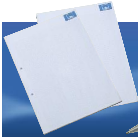
Art. No. 40073 Notizblock DIN A4, weiß, 50 Blatt, kariert. Note pad DIN A4, white, 50 pages squared.