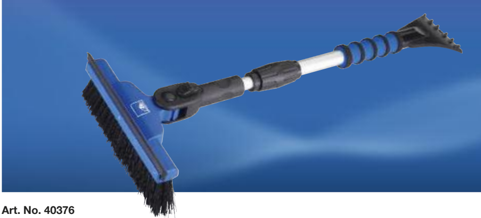
Art. No. 40376