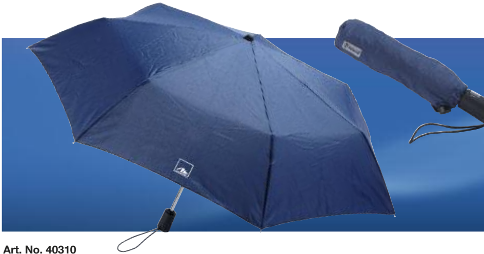
Art. No. 40310