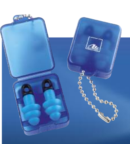
Art. No. 40366

Torch clip for LED torch (item no. 40359). Color: black. With a screw fastener on the one side and a clip to take the torch on the other. Practical rubber linings for non-slip attachment. Both elements may be rotated through 360 degrees.