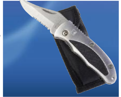
Art. No. 40325

RainLite® TRIMAGIC® mini pocket umbrella, 55 cm / 7 parts, 3-part patented frame, black with chrome-plated steel shaft, opens and closes automatically, specially coated black plastic grip with release button, cover made of 100% polyester with special Teflon® coating, water and dirt resistant, sheath in matching color, windproof design with new Fibertec® rail construction (certified by TÜV technical inspection association), approx. 28 cm long when closed, approx. 98 cm open diameter.