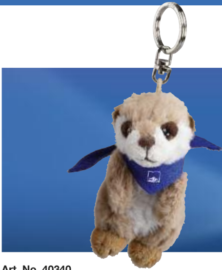
Art. No. 40340