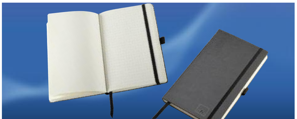
Art. No. 40302 Notizbuch DIN A5 Der Notizbuch-Klassiker im Retro-Look. Notizbuch mit Gummizug und praktischer Stiftschleife. Inhalt: 96 Blatt hochwertiges, kariertes Schreibpapier in bester 80 g/m 2 Qualität, tintenfest. Einband in flexibler, schwarzer Balacron-Machart, Format: ca. DIN A5.

Holospot basic magnifier tesa scribos® basic magnifier with key ring flashlight. Enables complete readout of ATE Holospot security codes and logos.