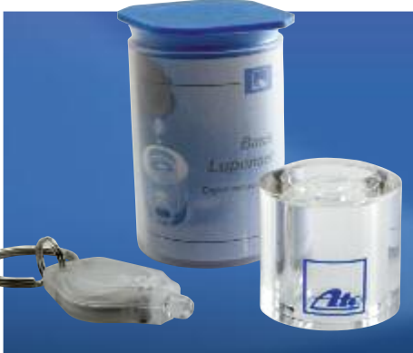
Art. No. 40275 Holospot Basis-Lupe „tesa scribos®“ Basic-Lupe mit Key-Ring-Taschenlampe zum visuellen Auslesen des kompletten ATE-Holospot-Sicherheits-Codes und des Markenlogos.

Holospot basic magnifier tesa scribos® basic magnifier with key ring flashlight. Enables complete readout of ATE Holospot security codes and logos.