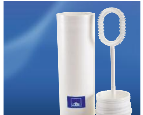
Art. No. 40330

A sporty design for jobs requiring finesse. Very comfortable to wear, thanks to flexible back material. Rubber seam on the back of the hand ensures perfect seating. The back material is breathable and provides more comfort for wearing over long periods. The palm surface made from synthetic leather is moisture-repellent. The glove can be used as a personal safety article in acc. with Category 1 of DIN EN 420 for minor mechanical risks. Size L + XL.