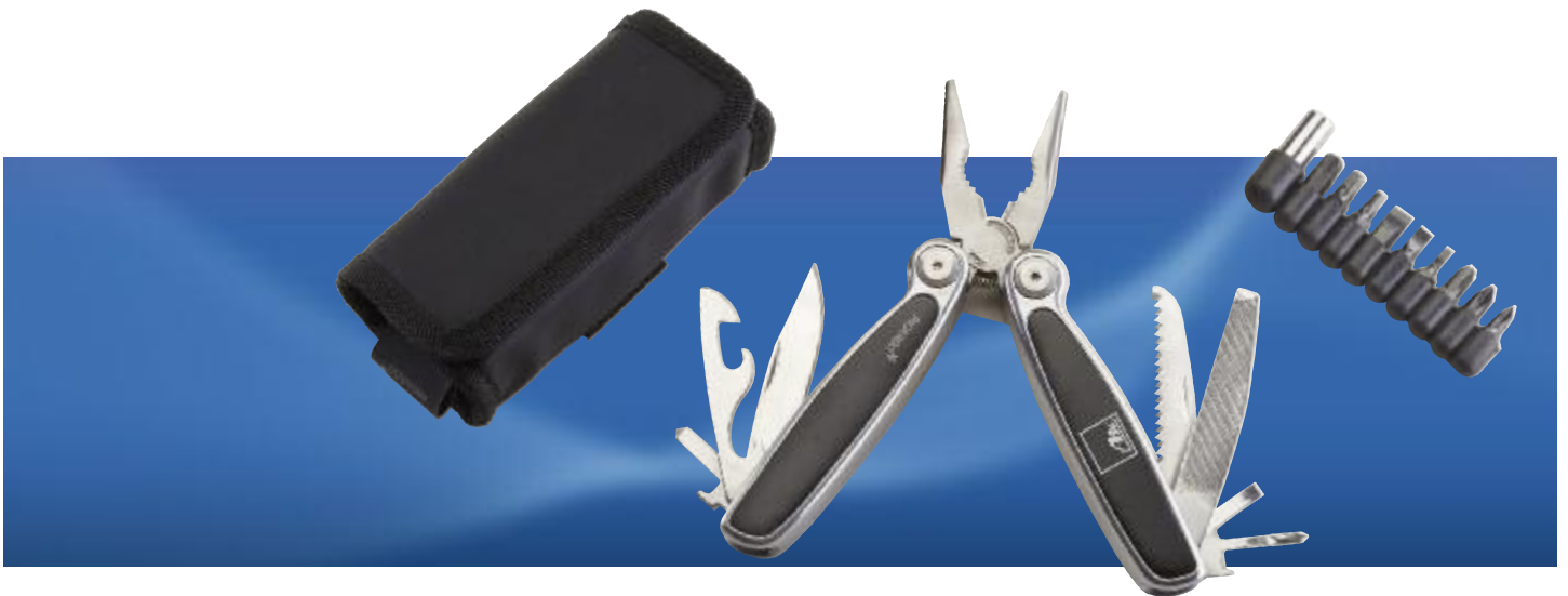
Art. No. 40377

High quality quartz chronograph. 24 hr display, mineral glass, stainless steel base, 3 ATM. Exclusive stainless steel linked wristband. Supplied with brand battery. Attractively gift wrapped.