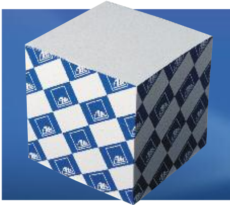
Art. No. 40005 Zettelklotz Scribbling block 10 x 10 x 10 cm.