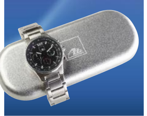
Art. No. 40338

Innovative and practical! Makes light work. The telescopic handle (66 cm - 89 cm) takes the strain out of clearing snow and ice from your car. The brush can be angled at 90 degrees. The non-slip soft grip makes for ease of use. Made of extremely sturdy, high quality polycarbonate.