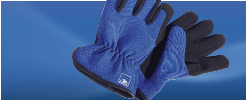
Art. No. 40387 + 40339

Perfect shape, perfect function. Metal grip with raised ergonomic nubs. With belt clip. Presented in a nylon sheath with belt loop. Dimensions when closed: approx. 9.5 x 3.2 x 1.9 cm.