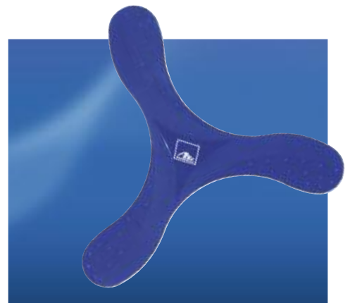
Art. No. 40346

Simply delicious! Content: approx. 20g sugarfree Starmint peppermint pastilles. High quality design hinged tin. Dimensions: 6 x 1.5 x 5 cm.