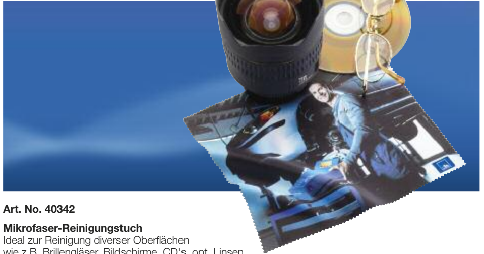
Art. No. 40342

Keyring, washable at 30 °C, made from synthetic fur. Dimensions: approx. 10 cm. Filled with synthetic wadding and beanbag granules. Nickel-free keyring, tested according to European toy standard EN71.