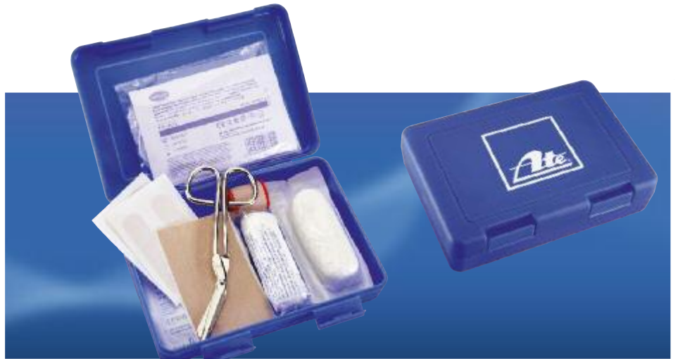
Art. No. 40369

When you can't avoid loud noise, these high quality ear-plugs are just the job. 1 pair Save Rave reusable ear-plugs in a plastic case, including ball chain.