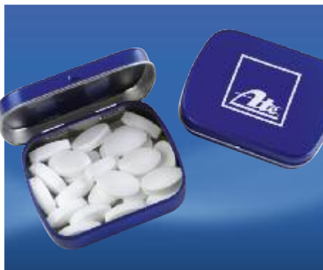
Art. No. 40345

Keyring with practical shopping cart chip carabiner clip.