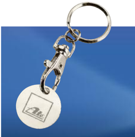
Art. No. 40343

Ideal for cleaning various surfaces such as eyeglasses, monitors, CDs, optical lenses, mobile phone and camera displays, coins, jewelry. Format: 15 x 15 cm.