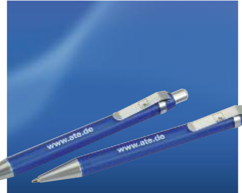
Art. No. 40195 Kugelschreiber Arctis Druckkugelschreiber mit transparent gefrostetem Schaft. Metalldrücker, -clip, -spitze verchromt. Mine blau schreibend. Ball-point pen Arctis Retractable ball-point pen with transparent frosted shaft. Chrome-plated metal retractor, clip, and tip. Blue ink.