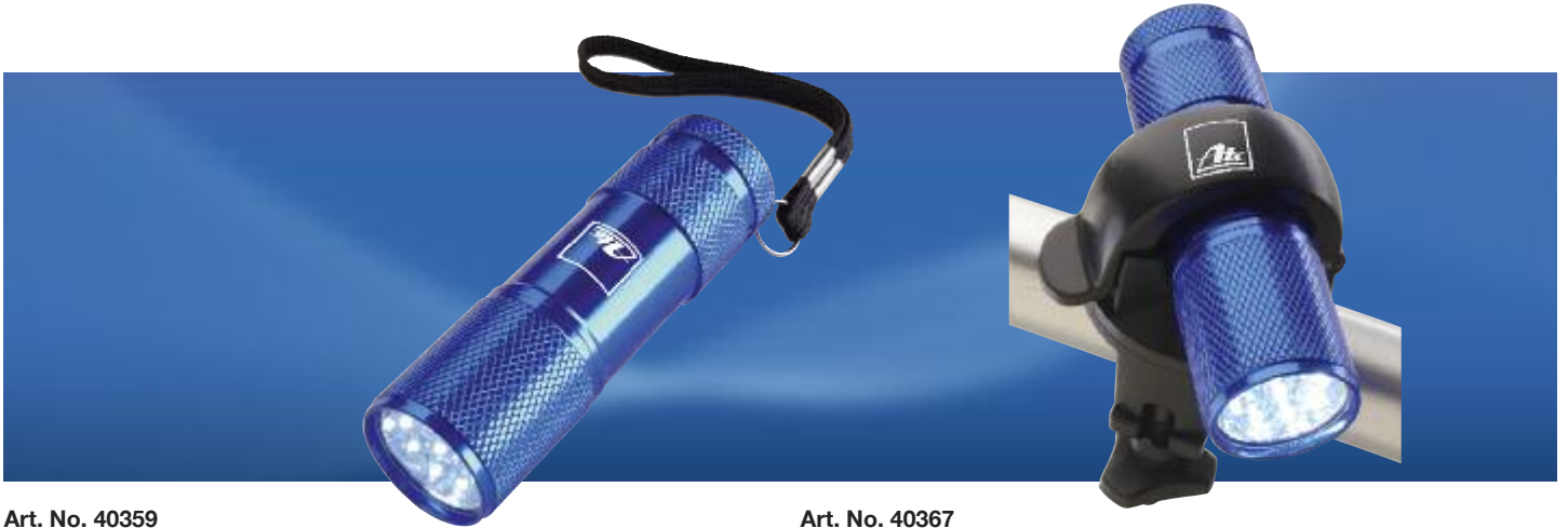
Art. No. 40359